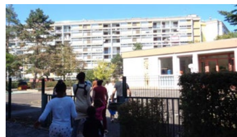
Au vu des critères socio-culturels de ce quartier Politique de la ville de Châlons-sur-Saône, les quatre écoles devraient être en REP.

dans l'école, « elle peut monter jusqu'à 22 élèves » qui rejoignent les autres élèves lors de séquences. L'école s'inquiète également pour son « Plus de maîtres », « Pourra-t-on le conserver ? » Résultat, le quartier s'est mobilisé, autour d'une intersyndicale dont le SNUipp-FSU est partie prenante et a mis en place des actions spécifiques. La demande est clairement, lors de la redéfinition de la carte en 2019, que les quatre écoles soient en EP. Sans réponses pour l'instant.